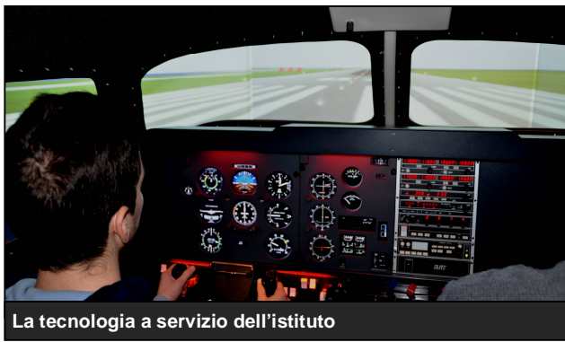
La tecnologia a servizio dell'istituto