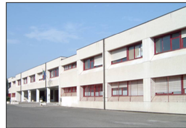
SEDE POLO TECNOLOGICO Via B.Matarazzo