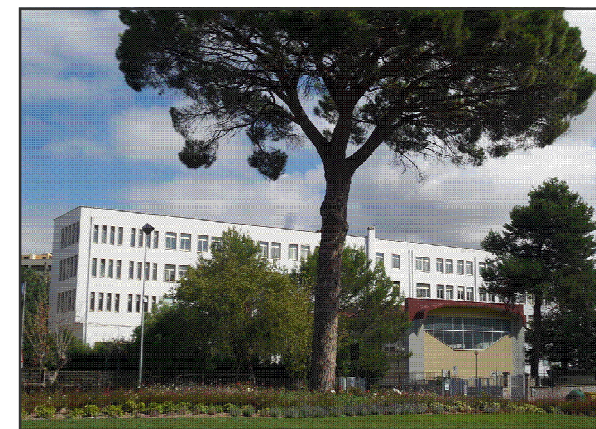
SEDE POLO ECONOMICO Via A.Moro